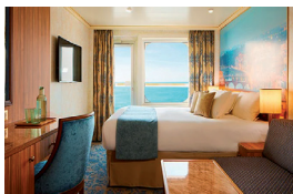
CABINA AMB BALCÓ

Sortida en grup des d'IGUALADA i Comarca