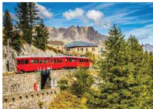
Tren cremallera a la Mer de Glace

Salida para visitar el Castillo de Chillon anidado sobre una roca. Es el monumento más visitado de Suiza,