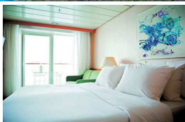
CABINA AMB BALCÓ