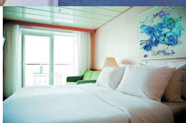
CABINA AMB BALCÓ

Sortida en grup des d'IGUALADA i Comarca